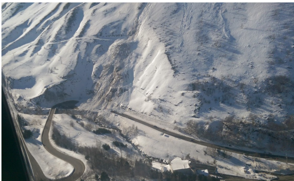
Avalanche mars 2025 sur le couloir H2

Or, il s'agit de l'unique voie de communication entre les deux pays permettant notamment l'approvisionnement des marchandises et la venue des touristes. Elle est donc essentielle pour assurer les activités principales de la Principauté basées sur le tourisme montagnard (randonnée, thermalisme, sports d'hiver) et le commerce. Elle supporte un trafic d'environ 8000 véhicules par jour le week-end et de 5000 véhicules par jour en semaine.